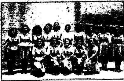
Brigada de Girl Scouts, que dio lustre al plantel durante algunos años porque realizó una encomiable labor de tipo cultural, social y benéfico.

El 19 de marzo de 1942 se forma la Brigada de Girl Scouts (Muchachas Guías), de grata recordación. Este selecto grupo de alumnas despliega, durante varios años, una intensa labor de tipo cultural, educativo y benéfico. En mayo y diciembre de cada año, las chicas guías agasajan a varias decenas de madres pobres, a quienes obsequian vestidos, cortes de tela, víveres, dulces y útiles escolares. Todo aquello se financia con los aportes voluntarios que cada guía hace de modo permanente.