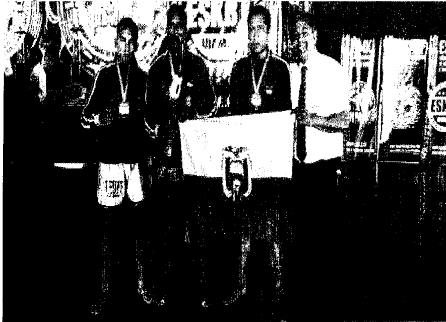
MDMQ Campeones mundiales de Kick Boxing