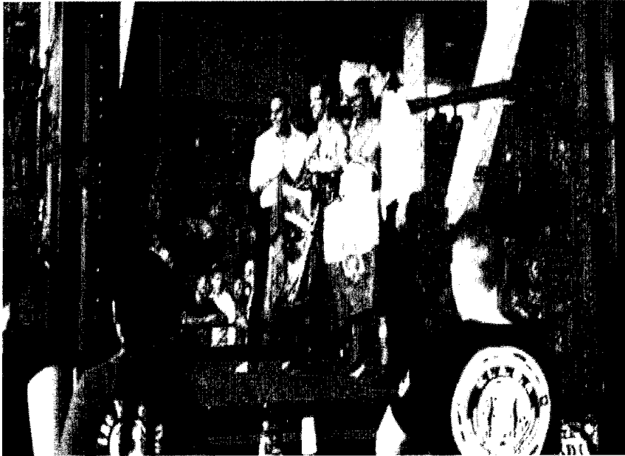
MDMQ Campeones mundiales de Kick Boxing