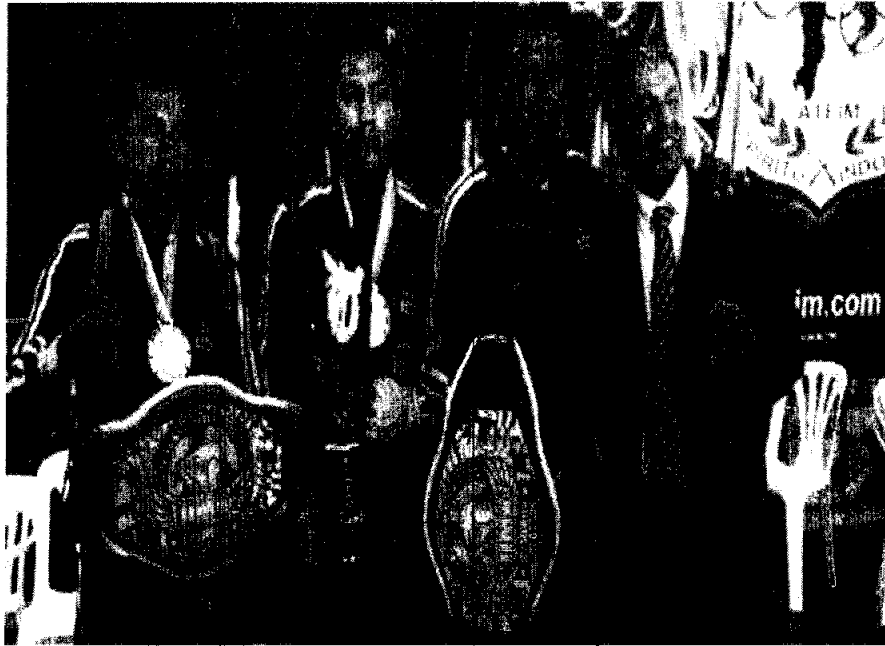
MDMQ Campeones mundiales de Kick Boxing

Fuente: Secretaría General de Seguridad y Gobernabilidad | 2015-11-17 | 05:57:12 AM