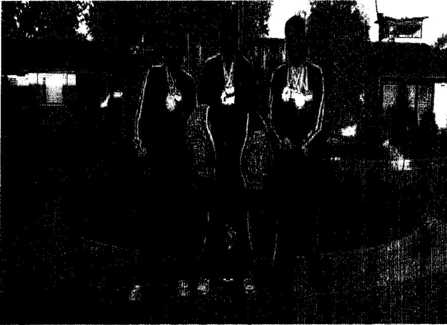
MDMQ Campeones mundiales de Kick Boxing