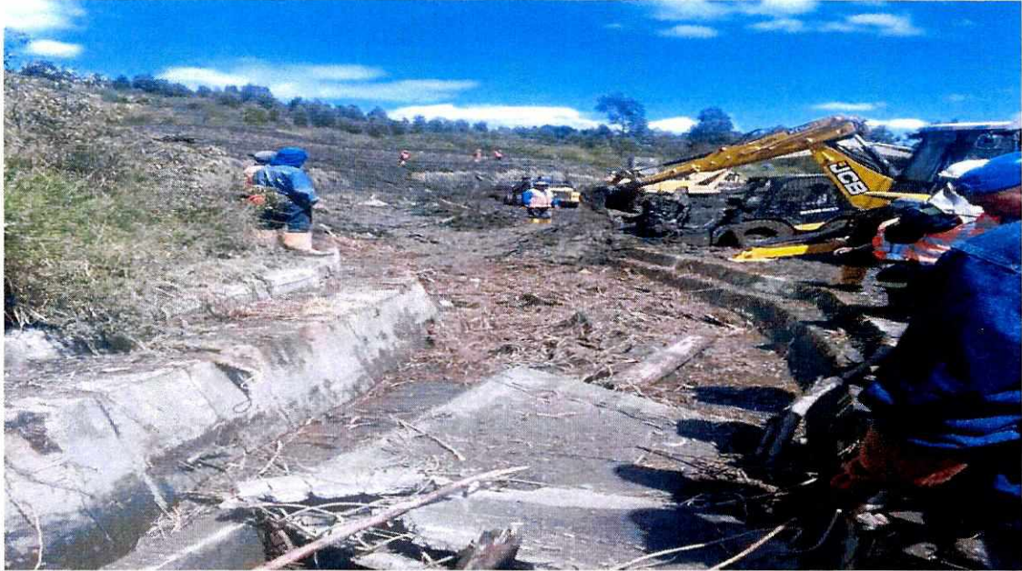
Limpieza del Canal del Pita