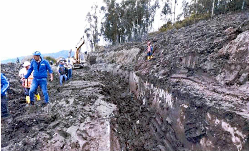
Retiro de losetas rotas del interior del Canal del Pita