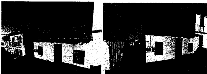
Vista de la fachada frontal en la que se evidencia los elementos compositivos de la misma.

De ser el caso en el que el propietario considere iniciar un proyecto de rehabilitación que contemple la incorporación de obra nueva, este deberá ser presentado a la Secretaria de Territorio Hábitat y Vivienda, cumpliendo con lo que establece la ordenanza de áreas y bienes patrimoniales 260.