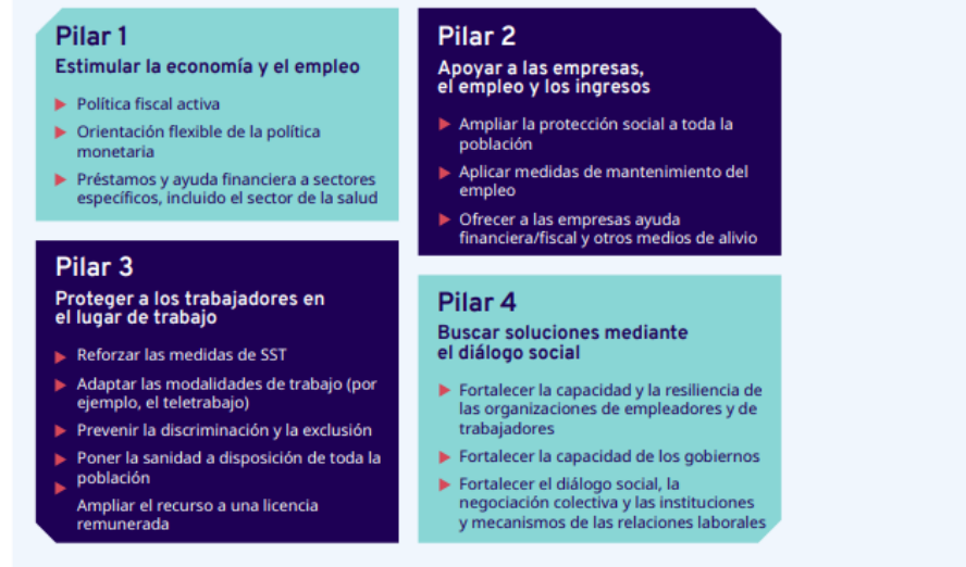
Tabla 5 Información publicada en el portal de la OIT.

► Gráfico 4. Marco de políticas: cuatro pilares fundamentales en la lucha contra el COVID-19 a partir de las normas internacionales del trabajo