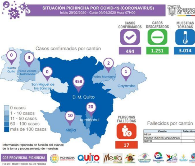
Tabla 3 Información publicada en el portal https://www.cerolatitud.ec

El detalle de casos confirmados por cantones de la provincia de Pichincha, al 09 de abril de 2020, reporta 458 en el Distrito Metropolitano de Quito.