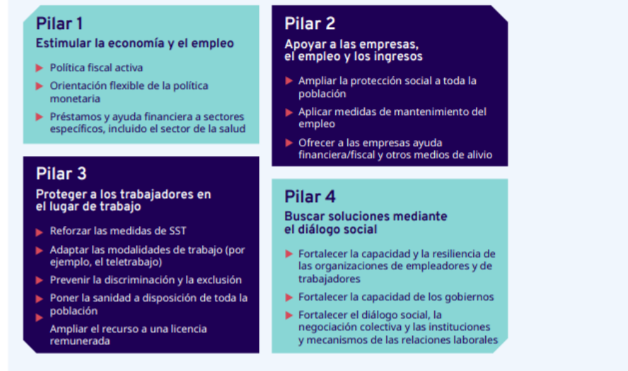
Tabla 5 Información publicada en el portal de la OIT.

► Gráfico 4. Marco de políticas: cuatro pilares fundamentales en la lucha contra el COVID-19 a partir de las normas internacionales del trabajo